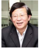
左良 东北大学副校长，教授 国家杰出青年科学基金获得者