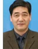
赵显利 北京理工大学副校长,教授 中国电子学会生命电子学分会理事长