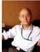
吴祈耀 北京理工大学教授、 中国电子学会生命电子学分会名誉理事长