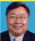
戴建平 北京天坛医院原院长，首都医科大学教授， 中华医学会副会长，原中华医学会放射学分会主任委员