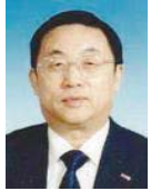
柴天佑 中国工程院院士 IEEE Fellow 东北大学教授