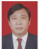
郑全录 东北大学教授 国家数字医学影像设备工程技术研究中心主任