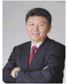
刘积仁 东北大学副校长，教授 计算机软件国家工程研究中心主任